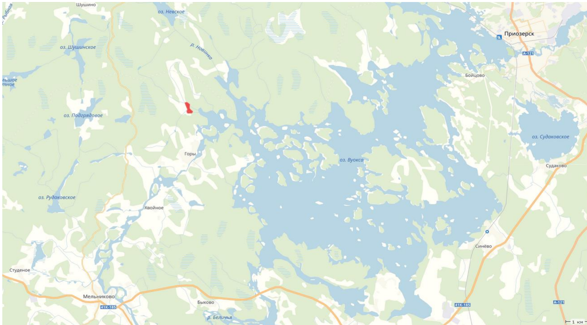
Схема рыбоводного участка безымянного озера, Приозерского района